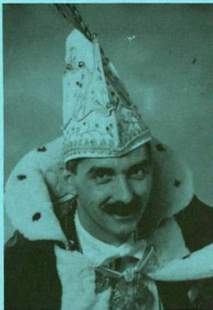
Brouwersgat tot ziens!

Wij hebbe begrepe da gullie van plan bent hillemol uit oewe'n bol te gaan mee carnaval. Ik wens jullie van harte ne goeie carnaval toe en eindig mee mèn leuze "Ge ziet mar wa ge doet n'n echte Strieper wit wel hoe 't moet!"