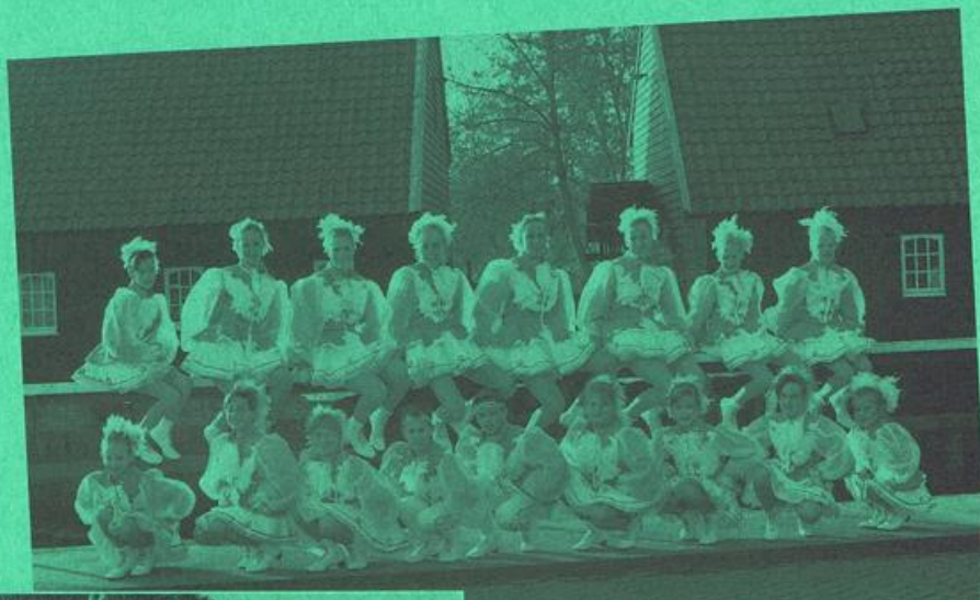
Grote en middelgrote

De gehele Dansgarde ziet er als volgt uit.