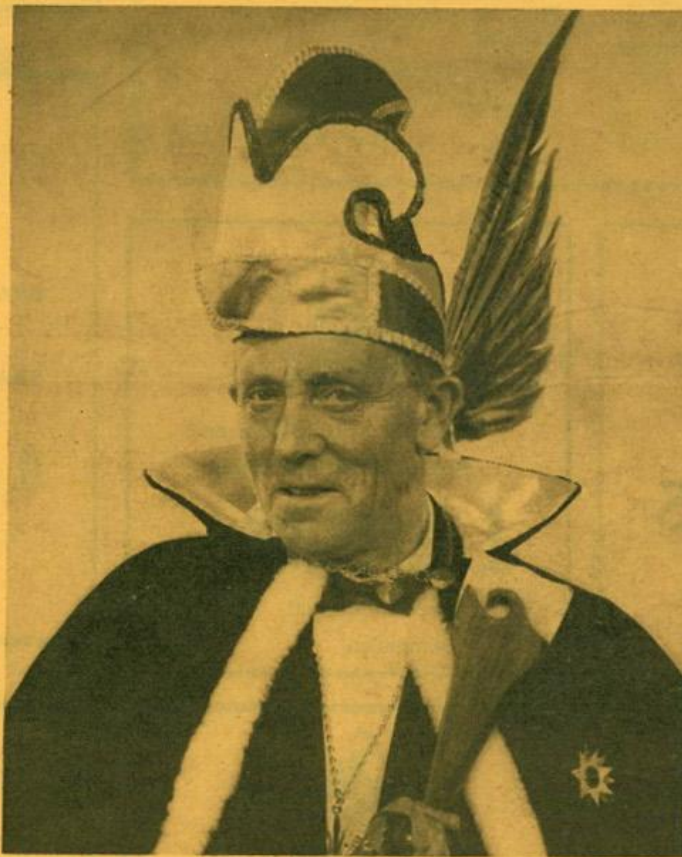
prins joep d'n urste

Pintenwippers en Pintewipperinnekes van Brouwersgat. Evenals in 1963 ben ik voor het jaar 1964 weer door U gekozen om als Prins Carnaval over Brouwersgat te heersen. Ik dank U voor het vertrouwen, dat U in mij geschonken hebt.