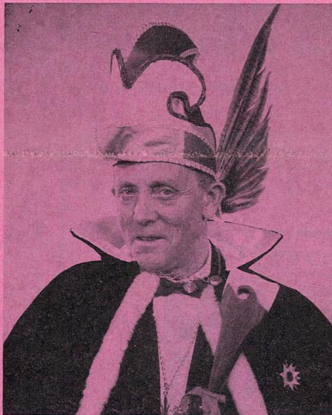
prins joep d'n urste